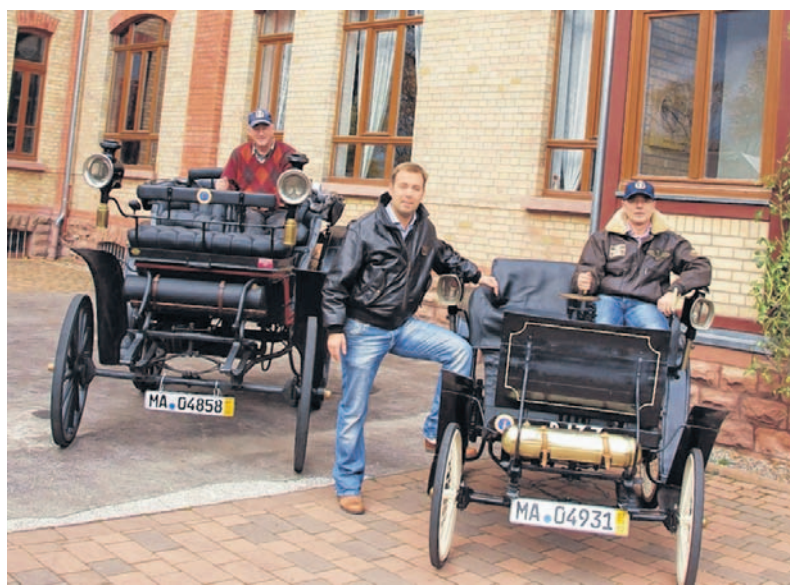
Männer des Mannheimer Schnauferl-Clubs auf dem Weg nach London.